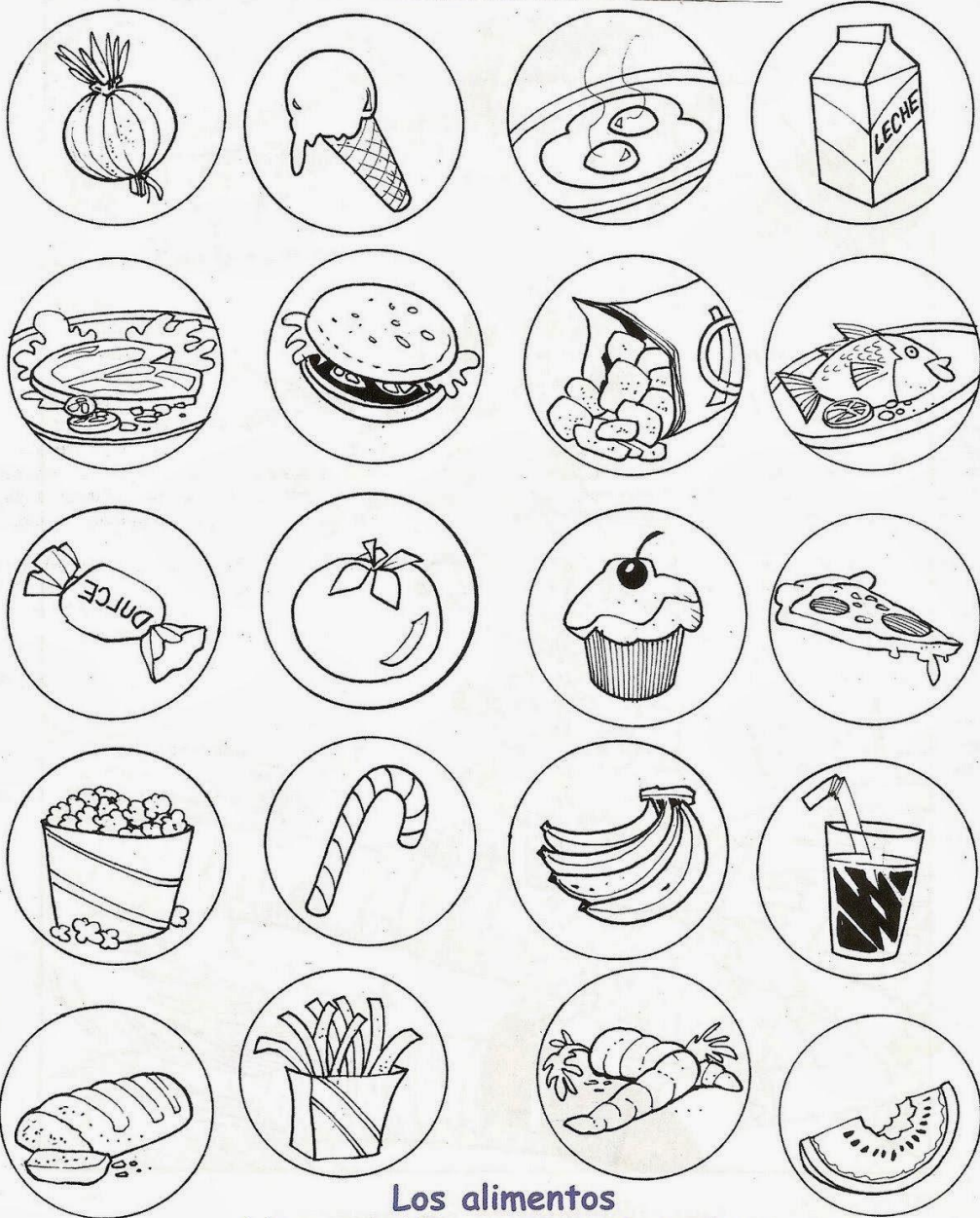
Los alimentos Colorea, clasifica y pega en tu cuaderno